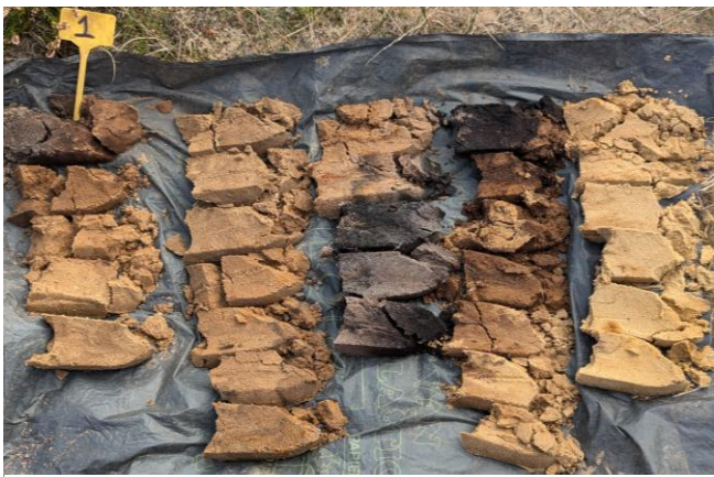
Een grondboring op een locatie in het veld. Veldonderzoek is een vast onderdeel van de LESA.

Deze overvloed aan gegevens leidt er echter nog niet toe dat het verband tussen deze gegevens en de kennis over het gebied duidelijk worden. Het samenbrengen en begrijpen van de verschillende elementen is essentieel voor een daadwerkelijk systeembegrip. Visualisaties zijn hierbij onmisbaar.